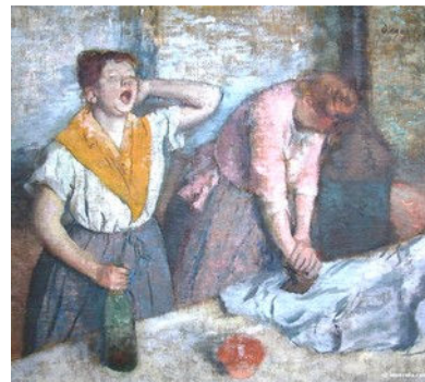
Edgar Degas - Les repasseuses

Les fers à repasser étaient des objets en fonte très lourds munis d'une poignée. Les femmes les posaient sur le feu pour les faire chauffer et utilisaient de l'eau pour défroisser le linge. Avec l'évolution de la technologie, les fers chauffent seuls grâce à un système électrique et ont une réserve d'eau intégrée à l'appareil pour produire de la vapeur. Les repasseuses utilisaient des fers très lourds et peinaient de longues heures pour obtenir un linge parfaitement repassé. Les fers sont beaucoup plus légers et fonctionnels ce qui rend le travail de l'utilisateur moins pénible et plus rapide. Avec l'arrivée des commandes numériques, on verra sans doute apparaître des fers d'une nouvelle génération. Sauront-ils repasser sans intervention humaine ?