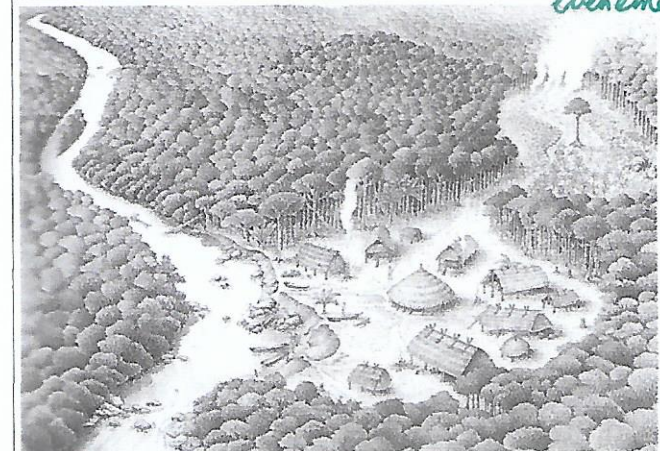
Doc.3 : Un village amérindien

de maison commune. Ils servent aux grands événements des Amérindiens et pour danser.