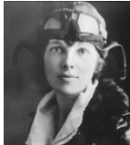
Amelia Earhart 1897