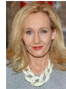
J. K. Rowling 1965