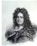
Charles Perrault 1628